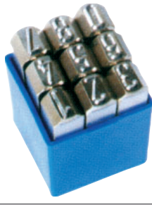
Nikel - Inox Tip Takımlar