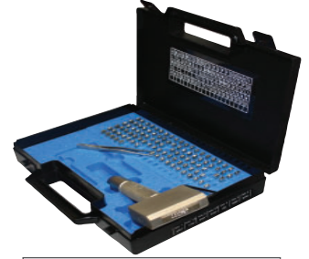
Harf & Numara Markalama Seti

Vürcümlü Numaralar & Harfler: Yüksek performanslı çelikten hassas ve derinlik sınırlamalı üretilmişlerdir. Çok net yazı görünümünü elde edilir ve okunaklıdır. Tam sertleştirilmiş sapları ve nikelajlı vurma yerleri ıslah edilmiş malzemeler üzerinde kullanımı mümkün kılar. 2000 N / mm 2 kadar mukavemetli malzemelerin markalanmasında kullanılabilir. Özel koronaklı plastik kutularda ambalajlanmışlardır.