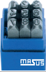
Numara Markalama Takımı ( Ters & Düz )