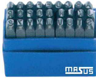
Harf Markalama Takımı ( Ters & Düz )