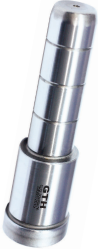
Kod: G 12

G 12 yağ kanallı tip stoklardan teslim edilir.